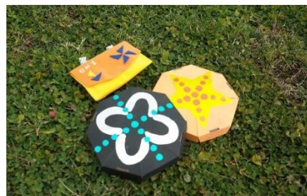
ひがた忍者ポーチ（左上）とクラゲ・ヒトデ模様の手裏剣（下）

伊賀忍者の元祖三重県伊賀市から、マキビン、水蜘蛛などの忍具のレプリカがやってきます（協力：三重大学国際忍者研究センター）。展示に関連する、実在した忍術についての解説も行います。